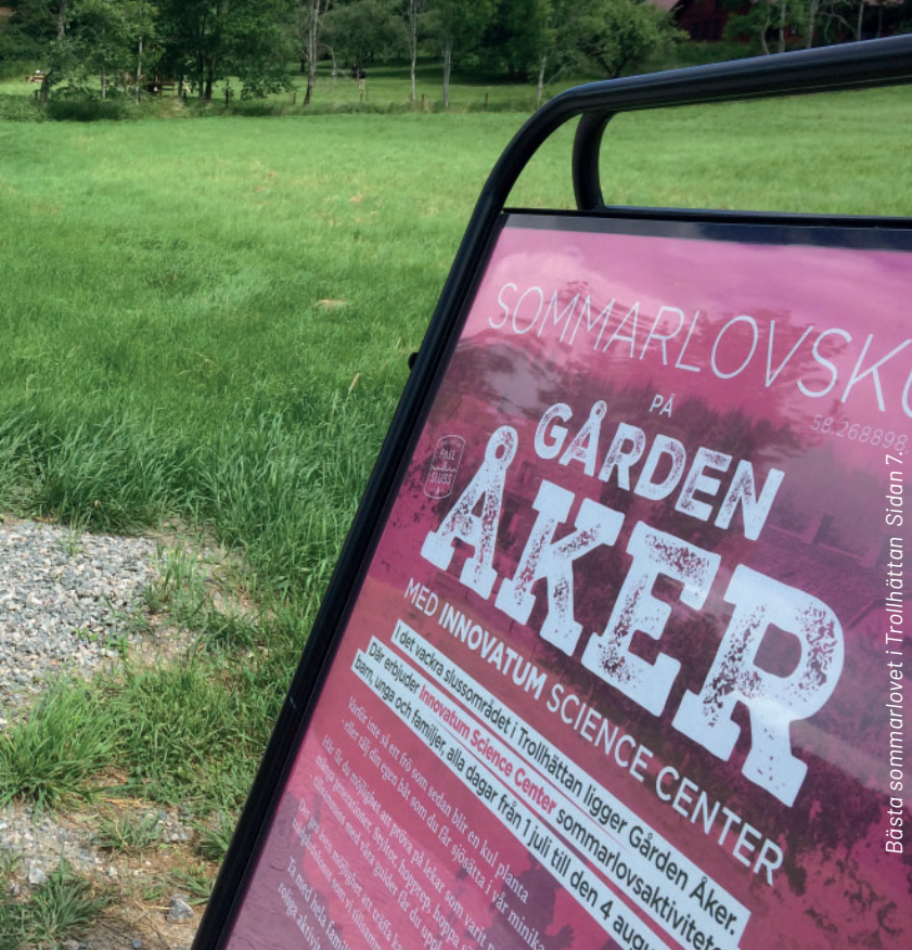
Bästa sommarlov i Trollhättan - Sidan 7.